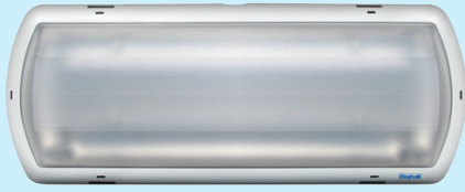
Tempesta MD DEL